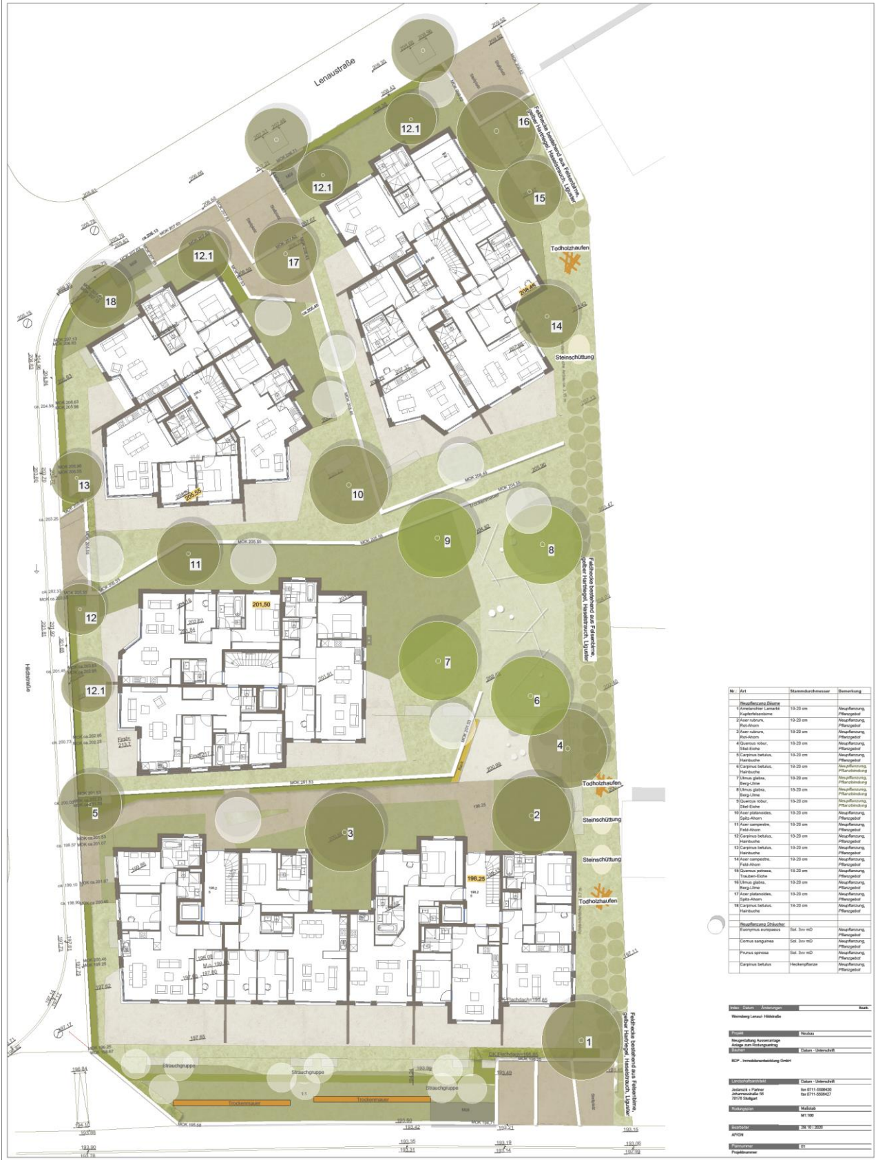
Abb. 1: Freiflächenplan des Büros Jedamzik+Partner Landschaftsarchitekten, Stuttgart, Stand: 30.10.2020.