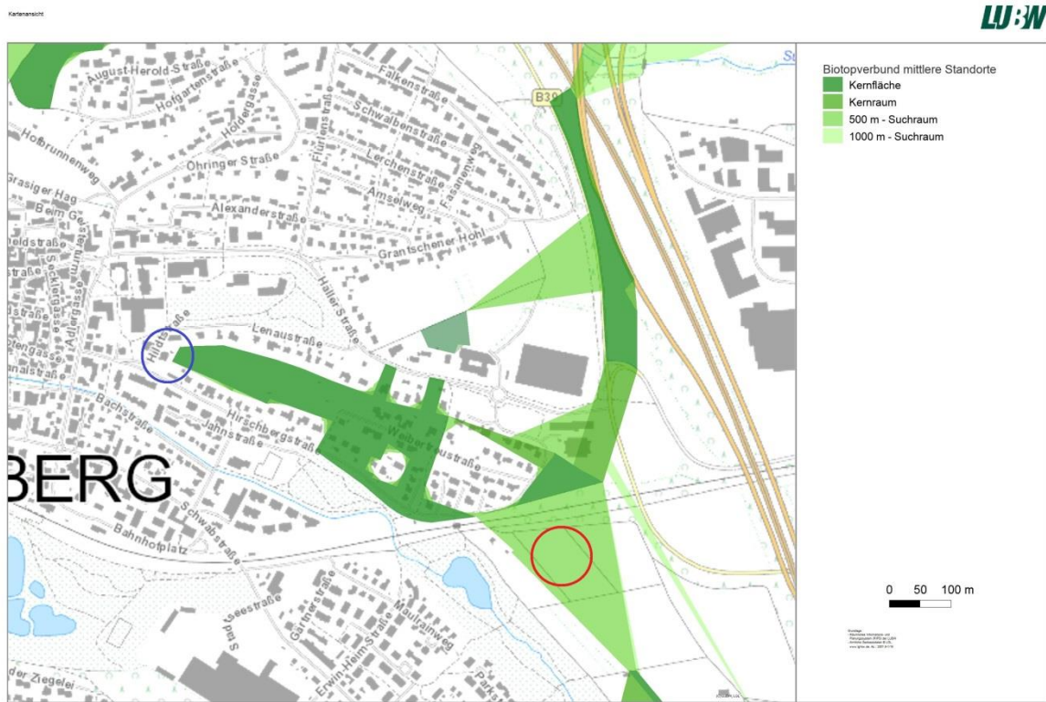
Abb. 3: Plangebiet (blaue Markierung) und mögliche Fläche für Gehölzpflanzungen im Gewann „Hinter dem Hirschberg“ (rote Markierung) als Kompensationsmaßnahme im Rahmen des Biotopverbunds mittlerer Standorte zum vorhabenbezogenen Bebauungsplan in Weinsberg „Lenaustraße 2 und Hildtstraße 7, Flurstück 2010 und 2011“ (Quelle: LUBW, ergänzt).

Die Kompensationsmaßnahmen sind auf der Gemarkung Weinsberg vorgesehen und müssen in Lage und Umfang noch mit dem Landratsamt Heilbronn und der Stadt Weinsberg abgestimmt werden. Dies gilt insbesondere für die im Rahmen des Biotopverbunds ggf. durchzuführenden Gehölzpflanzungen.